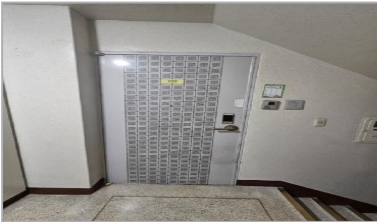
본 건물 호 전 경