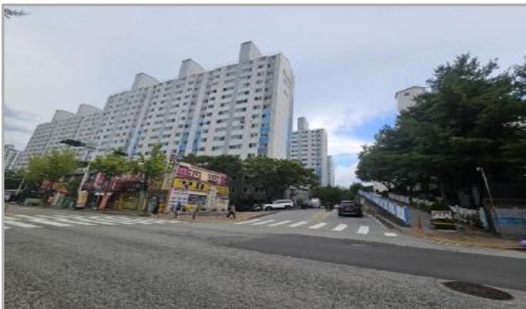
주 위 환 경