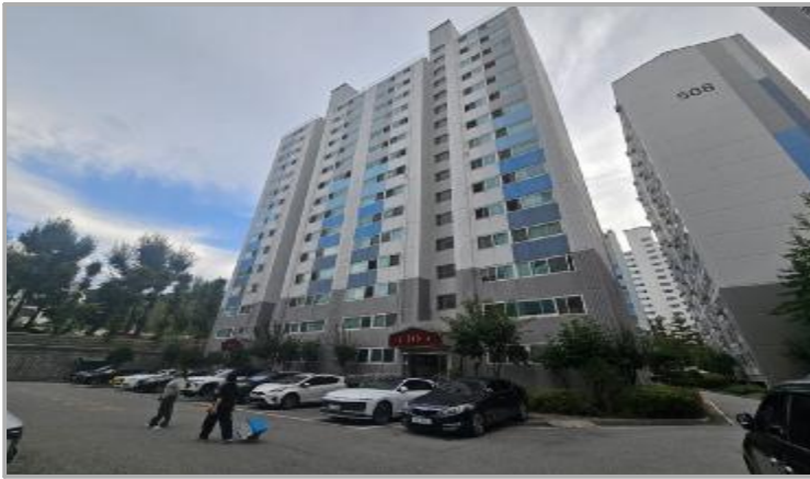
본 건물 전경