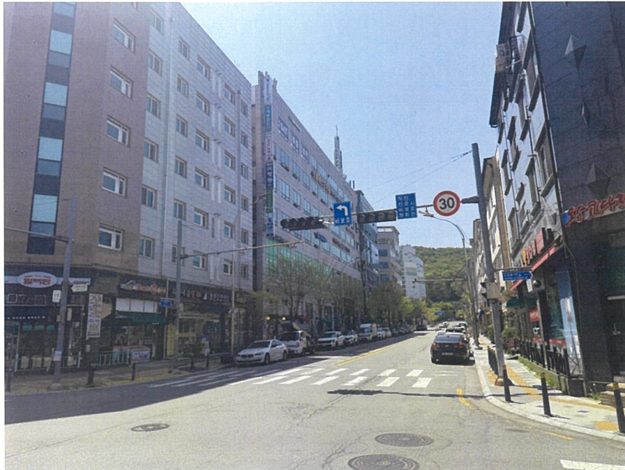
【 본건 주위환경 】