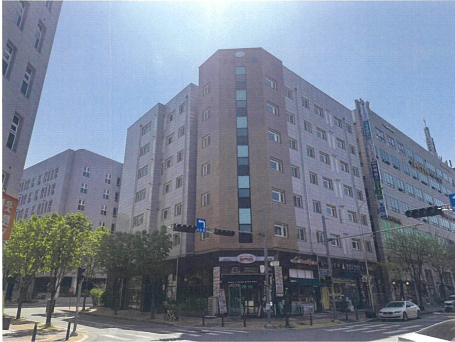
【 본건 전경 】