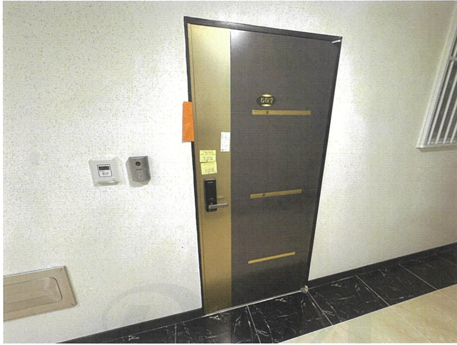
【 본건 현관입구 】