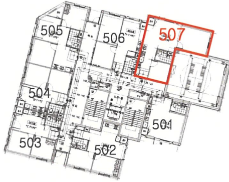
【 건축물현황도_평면도(5층) 】