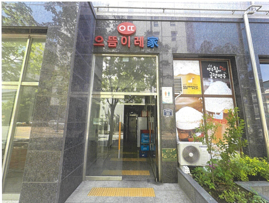
【 본건 공동출입구 】