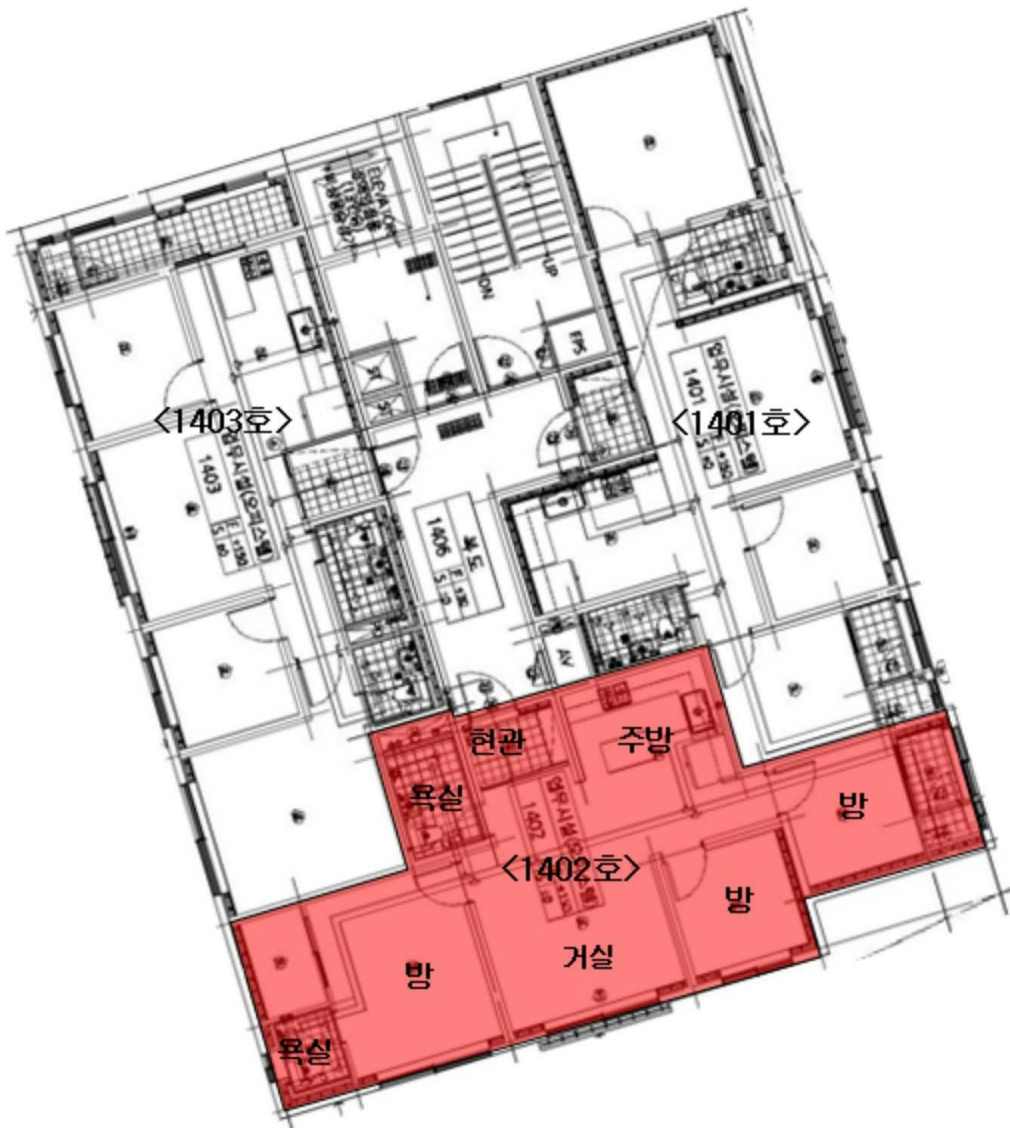
< 호별배치도 및 내부구조도 >