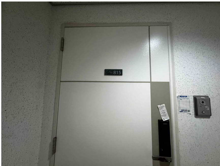
본건 개별 현관