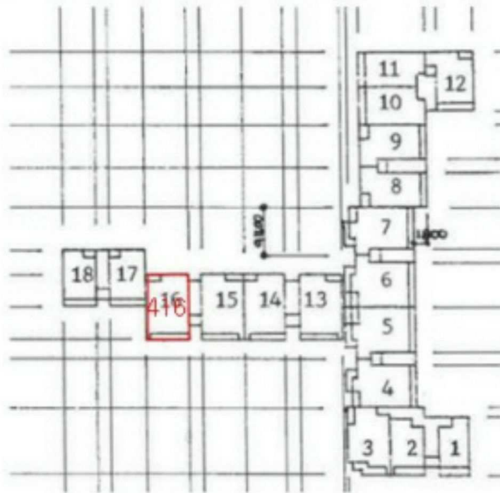
그린맨션 4층 416호