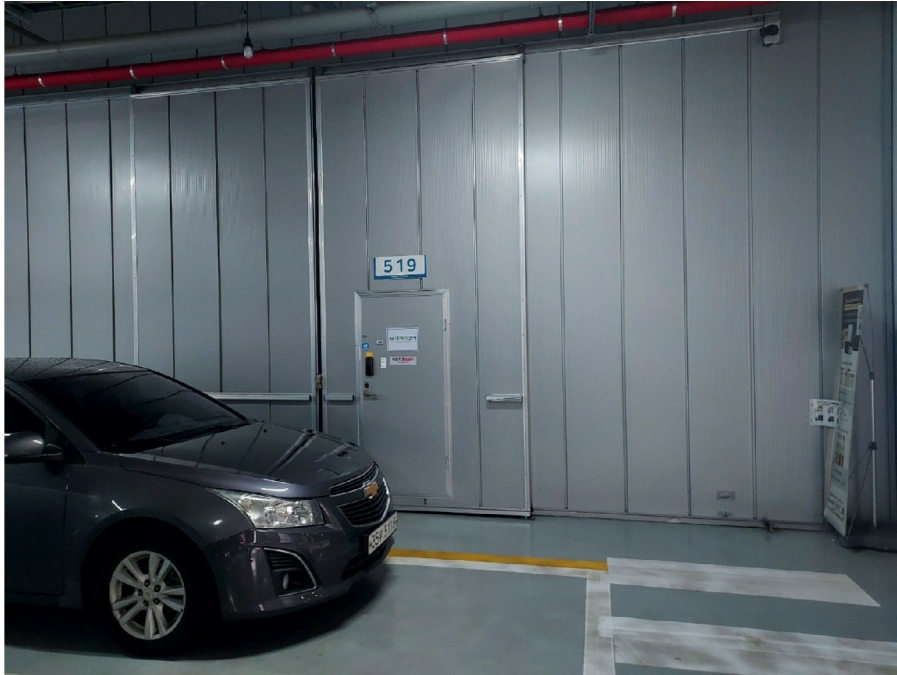
5 519 5