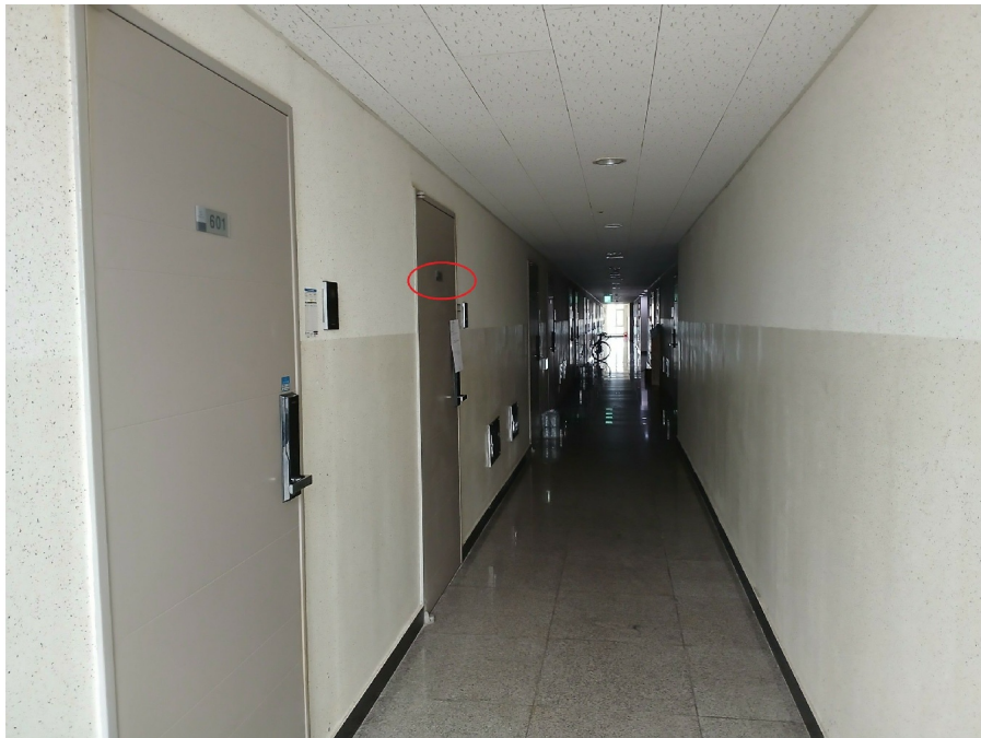
< 6 >