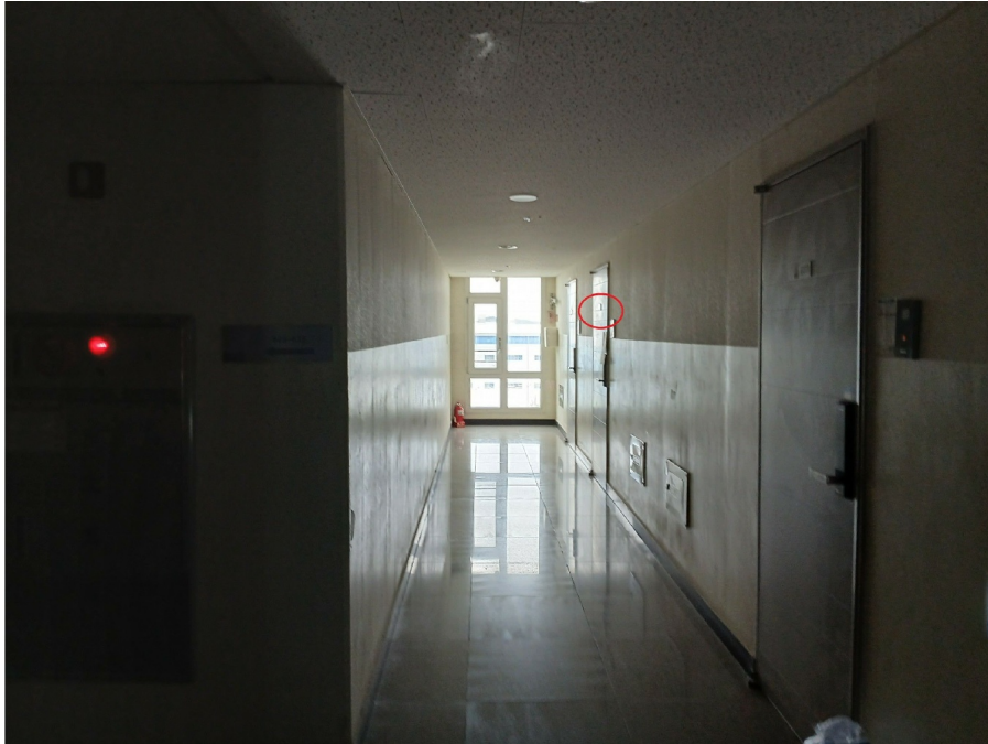
< 6 >