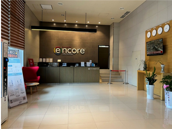
< 1 >