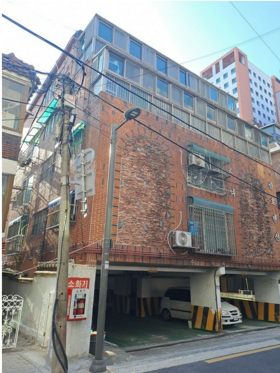
[ 2 ]