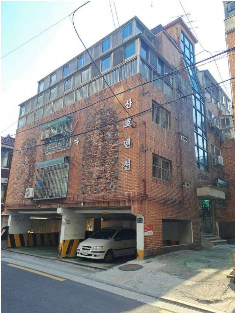
[ 1 ]