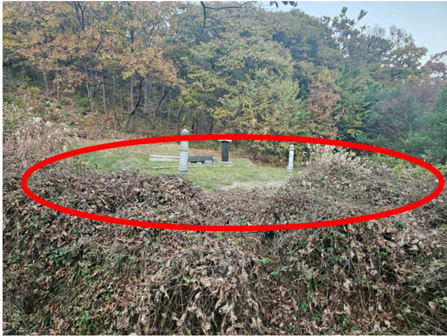
본 건 전 경