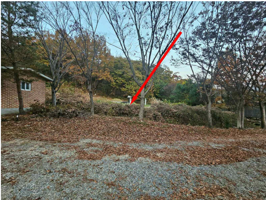
본 건 및 주 위 전 경