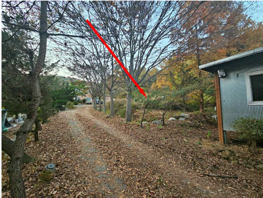
주 위 전 경 - 본건 남동측에서 촬영