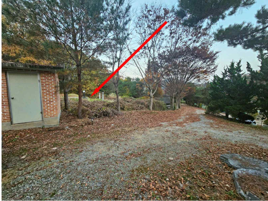
주 위 전 경 - 본건 북서측에서 촬영