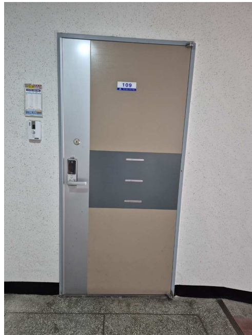
본건 109호 현관