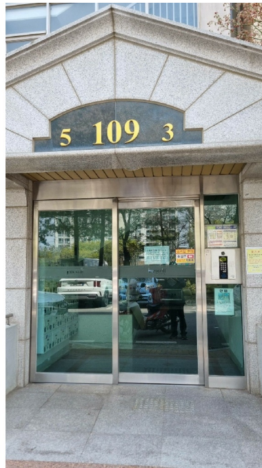
109 3 5