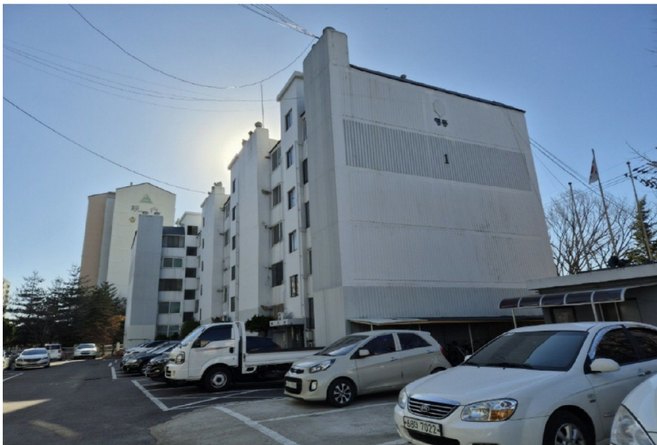
( 1 )