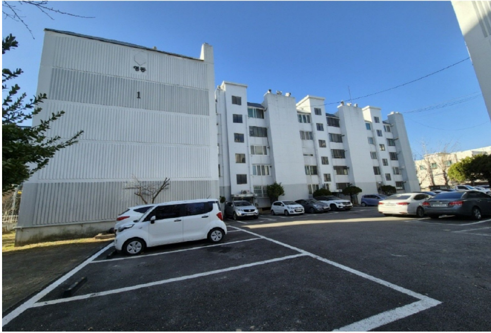
( 1 )