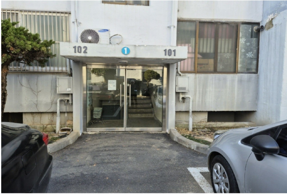
( 1 )