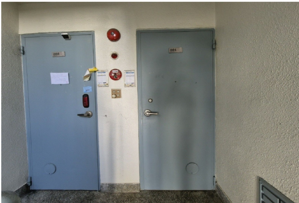
( 1 3 301 )