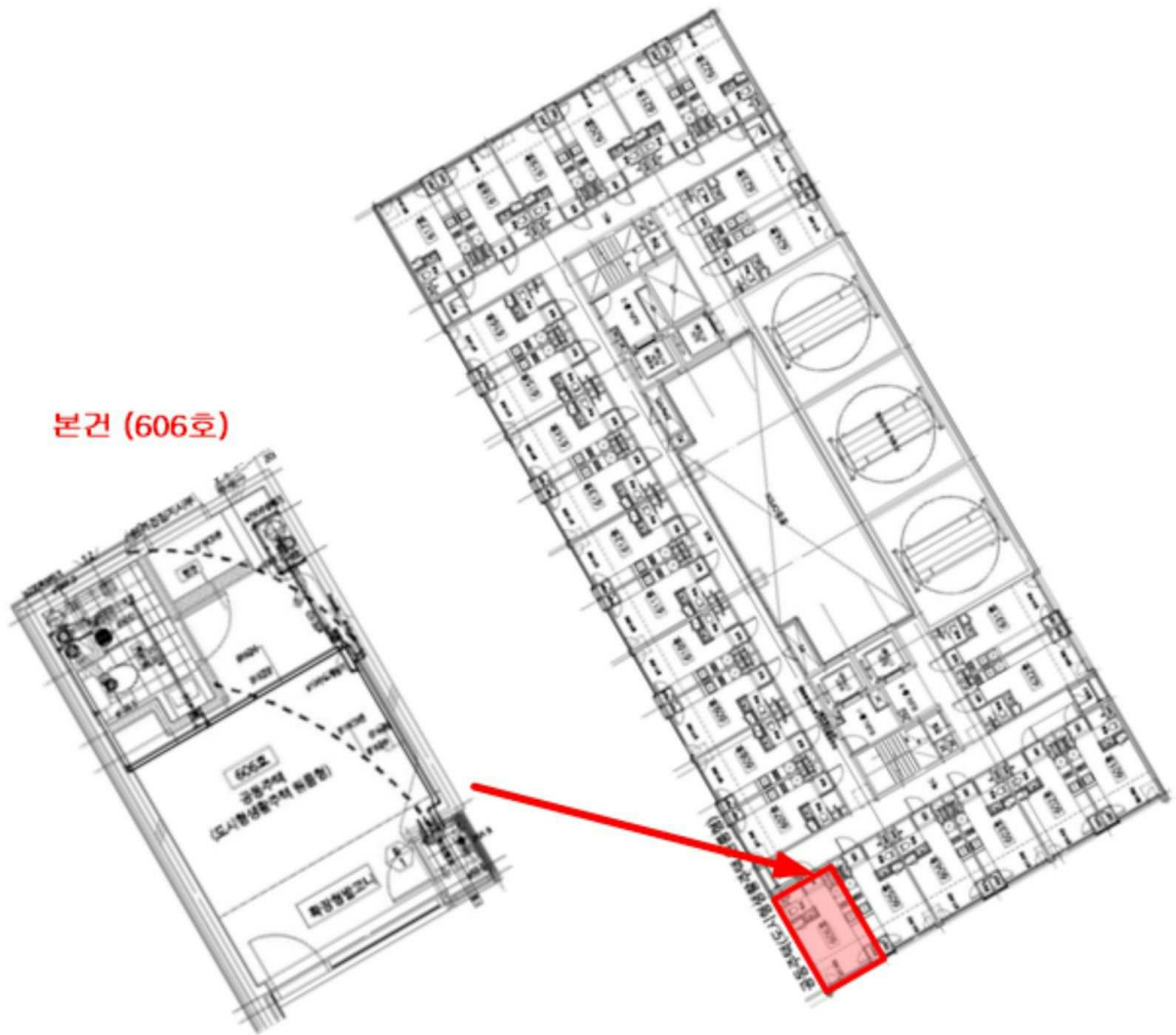
호별배치도 및 내부구조도