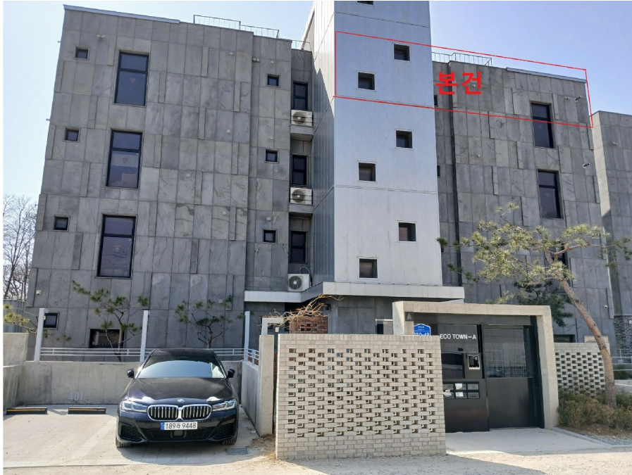
< ( 402 ) >