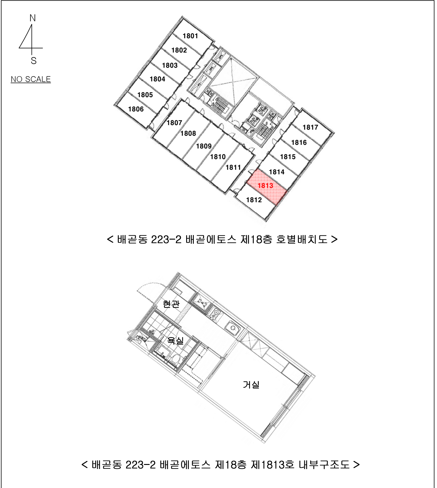
< 배곧동 223-2 배곧에토스 제18층 호별배치도 >